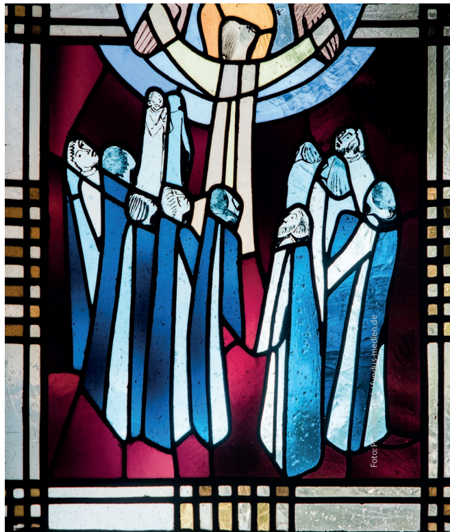
Kirchenfenster (Ort unbekannt)

Das Museum öffnet um 9:00 Uhr seine Tore. Der Eintritt ist für Gottesdienstbesucher dann frei. Im Anschluss an den Gottesdienst besteht die Möglichkeit, einen schönen Tag im Freilichtmuseum zu verbringen.