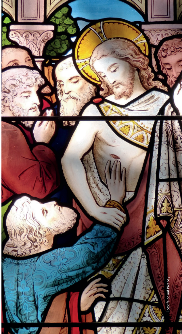
Kirchenfenster (Ort unbekannt)

Nur der eine, Thomas, der hat eben gefehlt. Und er muss sich von nun an auf das verlassen,